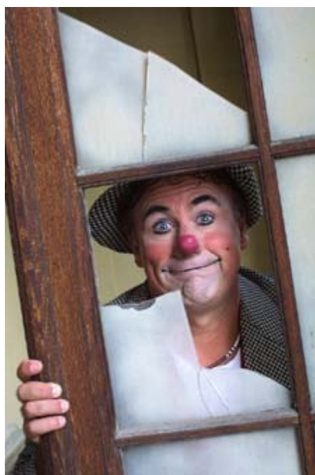
DAVID LARIBLE

E' con grande orgoglio che il Cedac può vantare, dall'inizio del 2005, la collaborazione del "clown dei clown" David Larible . Durante un recente soggiorno europeo, al grande clown è stata consegnata la Medaglia del Comune di Verona, dalle mani del Sindaco, per i particolari meriti di Cittadino Veronese nel mondo. Proprio in tale occasione l'artista ha visitato il CEDAC rilevando l'importanza del lavoro in corso ed accettando di far parte del gruppo dei Consulenti per la Ricerca e la Documentazione. Sua materia sarà, ovviamente, la storia e la pratica dell'arte del clown. Così da gennaio il Centro può vantare la firma di uno dei più grandi artisti viventi. La collaborazione verterà dapprincipio soprattutto in una consulenza generale a distanza, ma in seguito, durante le future visite in Europa, verranno organizzati stage e laboratori di clownerie ai quali ci si potrà iscrivere da tutta Italia.